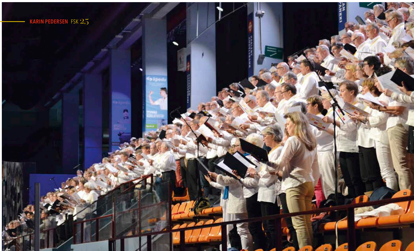
FSK på sångfesten i Karleby 2016.

att försöka ge körsångare kännedom om ny repertoar, att inte bara sjunga det redan välbekanta och att sätta ihop det i en genomtänkt helhet.